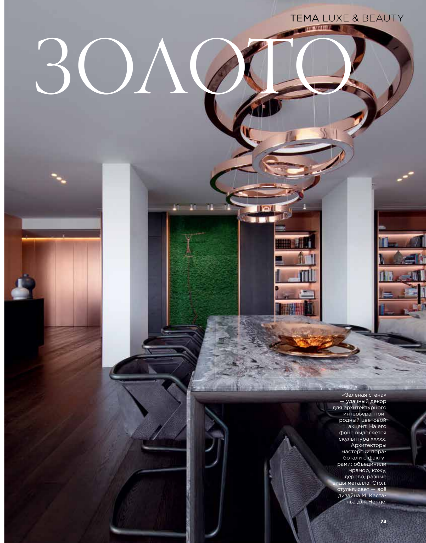
«Зеленая стена» — удачный декор для архитектурного интерьера, природный цветовой акцент. На его фоне выделяется скульптура xxxxx. Архитекторы мастерски поработали с фактурами: объединили мрамор, кожу, дерево, разные виды металла. Стол, стулья, свет — всё дизайна М. Кастанья для Henge.