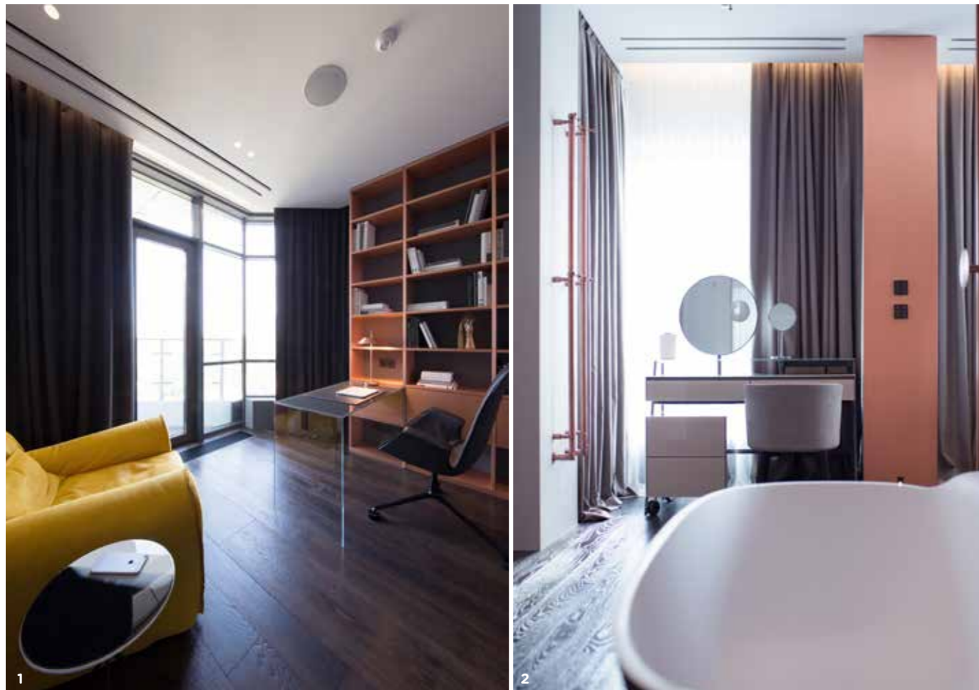
1. В потайной кабинет может войти только хозяин дома?? Кресло Baxter, стол xxxxx, рабочее кресло xxxxx. 2. В спальне, объединенной с ванной, у окна расположили изящный туалетный столик xxxxxx. 3. Гостевой санузел. На стенах мрамор bidasar green, отдельно стоящая раковина Falper с редкой фактурой под ржавую кортеновскую сталь. Смеситель CEA.