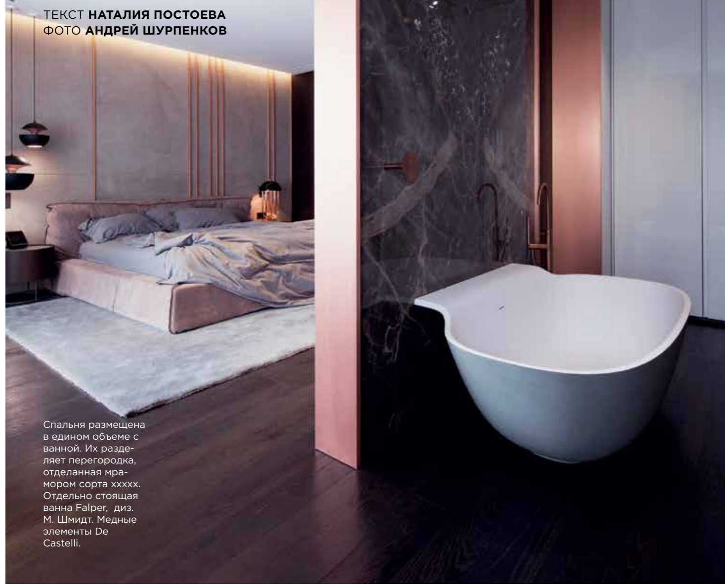
Спальня размещена в едином объеме с ванной. Их разделяет перегородка, отделанная мрамором сорта xxxxx. Отдельно стоящая ванна Falper, диз. М. Шмидт. Медные элементы De Castelli.

ТЕКСТ НАТАЛИЯ ПОСТОЕВА